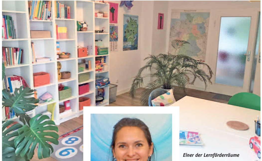
Einer der Lernförderräume

Die Lernförderung findet nicht nur Corona-bedingt als Einzel-