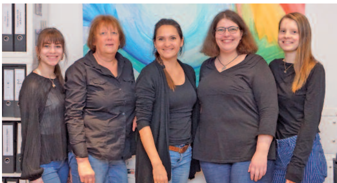
Das Büroteam in der List hilft bei allen organisatorischen Fragen und berät Sie gern persönlich oder telefonisch.